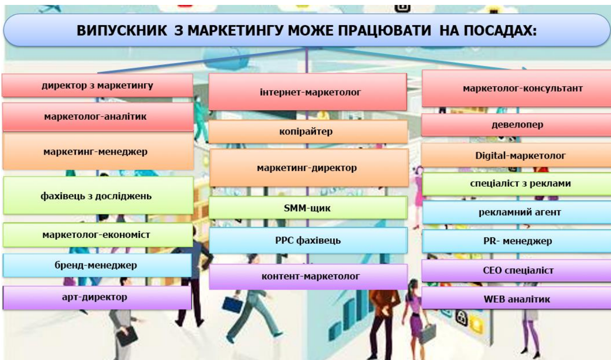
Рис. 2. Можливості працевлаштування випускників спеціальності «Маркетинг»

За даними Work.ua станом на квітень 2020 р. для