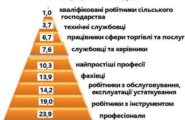
Рис. 3. Структура вакансій, зареєстрованих у центрах зайнятості (січень, 2021 р.)